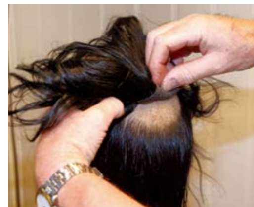
Hårlegget festes til hodet.