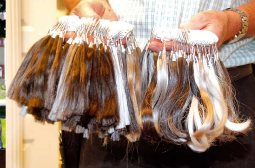
Hårlegget tilpasses så det blir like naturlig som eget hår.